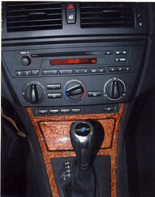
Mittelkonsole: Mit Klimaautomatik und Navigationsgerät wäre die Ausstattung des 64 000 Euro teuren Wagens perfekt.

Fazit: Der Hartge Hunter ist für Straße und Revier komfortabel gerüstet. Maßgeblich trägt dazu eine 6-Gang-Automatik mit guter Übersetzung bei. Die vom Hersteller angegebenen 9,4 Liter Verbrauch haben wir im Test nie ganz erreicht. Er macht einfach zu viel Spaß. ♦